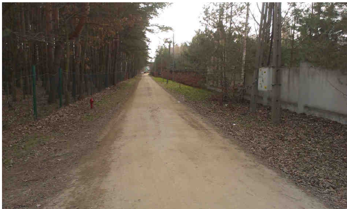
ZDJĘCIE 1. UL. TRAKTOWA

Droga posiada uszkodzoną nawierzchnię, z tłucznia kamiennego i pospółki oraz pyłu, dobrze zagęszczoną o grubości warstwy ok. 0,30m. Szerokość drogi w stanie istniejącym wynosi od ok. 3,00m do 3,80m.